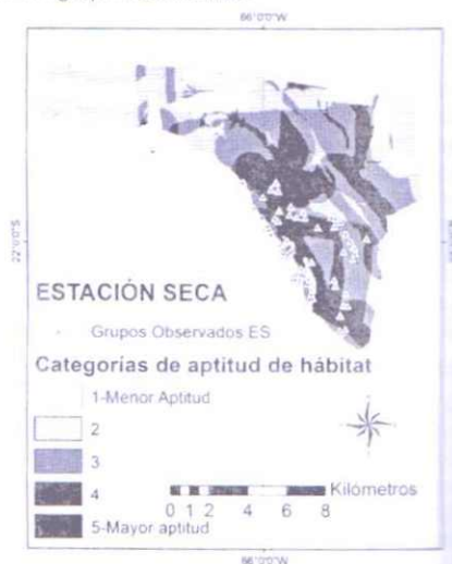
Fig. 2. Mapa de aptitud de hábitat para la estación seca, en relación con distribución de los grupos de vicuñas.